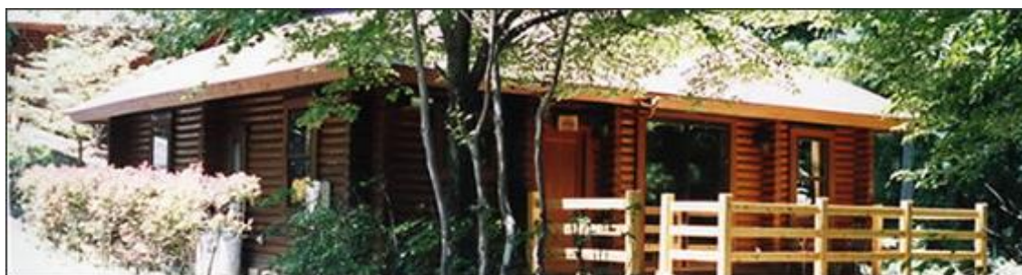
(東京都奥多摩町 秩父多摩甲斐国立公園・山のふるさと村)

キガタメール6号Lは屋外木部含浸強化剤で、主としてログハウス等に使用されています。 本製品は浸透性に優れたウレタンプレポリマーを使用しており、木部深くに浸透し、表面から内部まで反応・強化し防湿及び防カビ効果を発揮します。 表面に塗膜を形成しないため、塗膜のはがれ、剥離の発生は有りません。